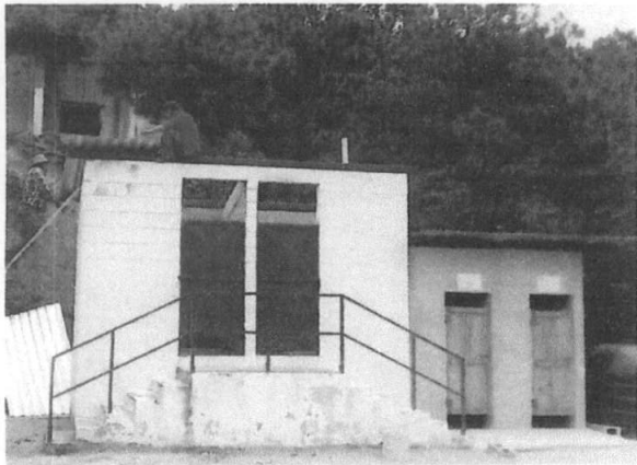
Foto 3: Área donde se está realizando el mejoramiento e instalación de cubierta de lámina en los servicios sanitarios.