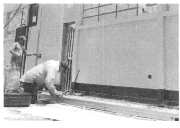
Foto 4: Área donde se está realizando el mejoramiento e instalación de puerta de metal.

Observación: Si es necesario se pueden agregar hojas adicionales y actualizar el número de hojas.