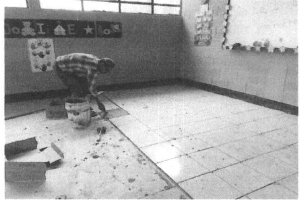
Foto 2: Área donde se está realizando el mejoramiento de piso e instalación de tipo cerámico.